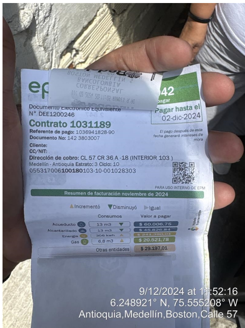
Descripcion: FACTURA EPM CON SERVICIO DE ALCANTARILLADO