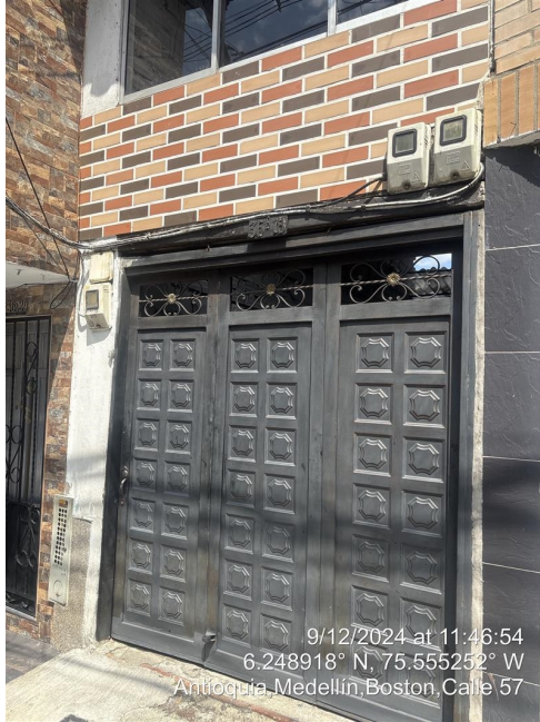
Descripcion: FACHADA INMUEBLE VISITADO